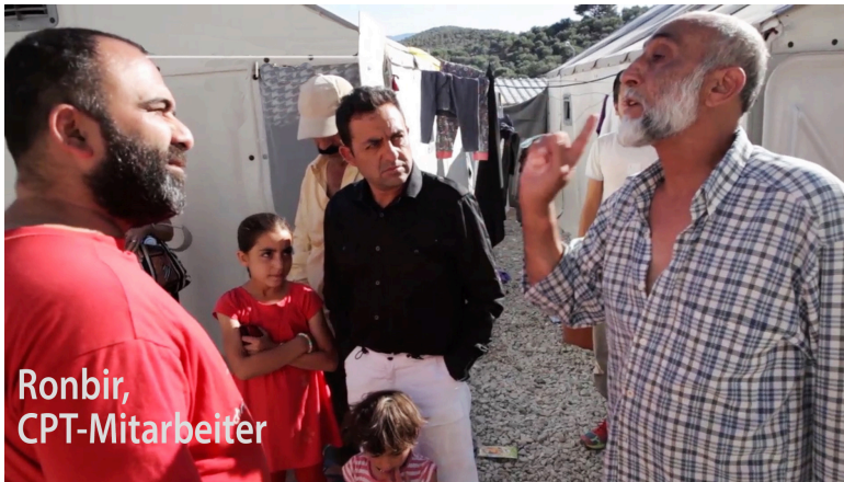
CPT-Mitarbeiter im Gespräch in einer Zeltlage bei Moria

Die Kosten betragen 500 € pro Person (Kost und Logis, im Einzelzimmer), Flugkosten nicht eingerechnet. Teilnehmende sollen ihren eigenen Flug buchen. Ankunft am Nachmittag des 6. September in Votsala Hotel. Abholung am Flughafen ist auch möglich.